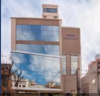
LA TORRE DIAGNÓSTICA

Autores: Echevarría F., Haulet V., Difilippo P., Enria D.